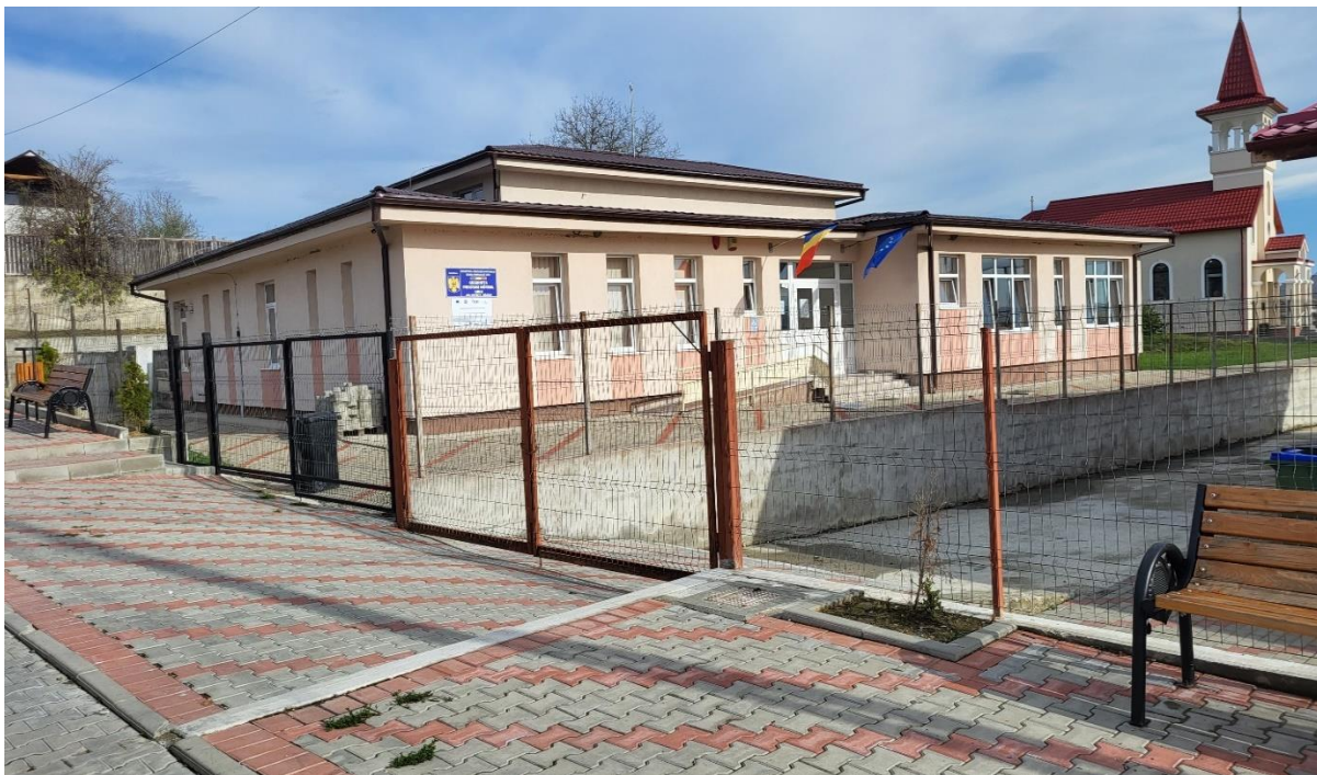
Clădirea nouă a Grădiniței cu Program Normal Uriu cu curtea pentru joacă