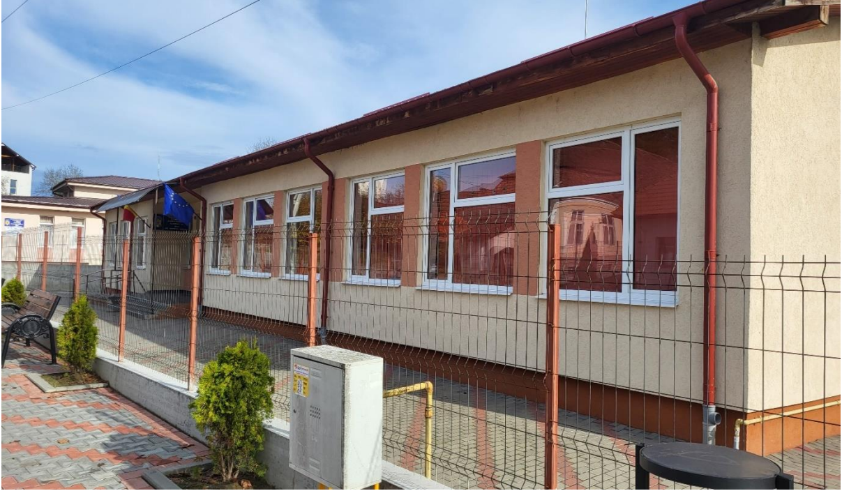
Clădirea Școlii Gimnaziale cu clasele CP-IV