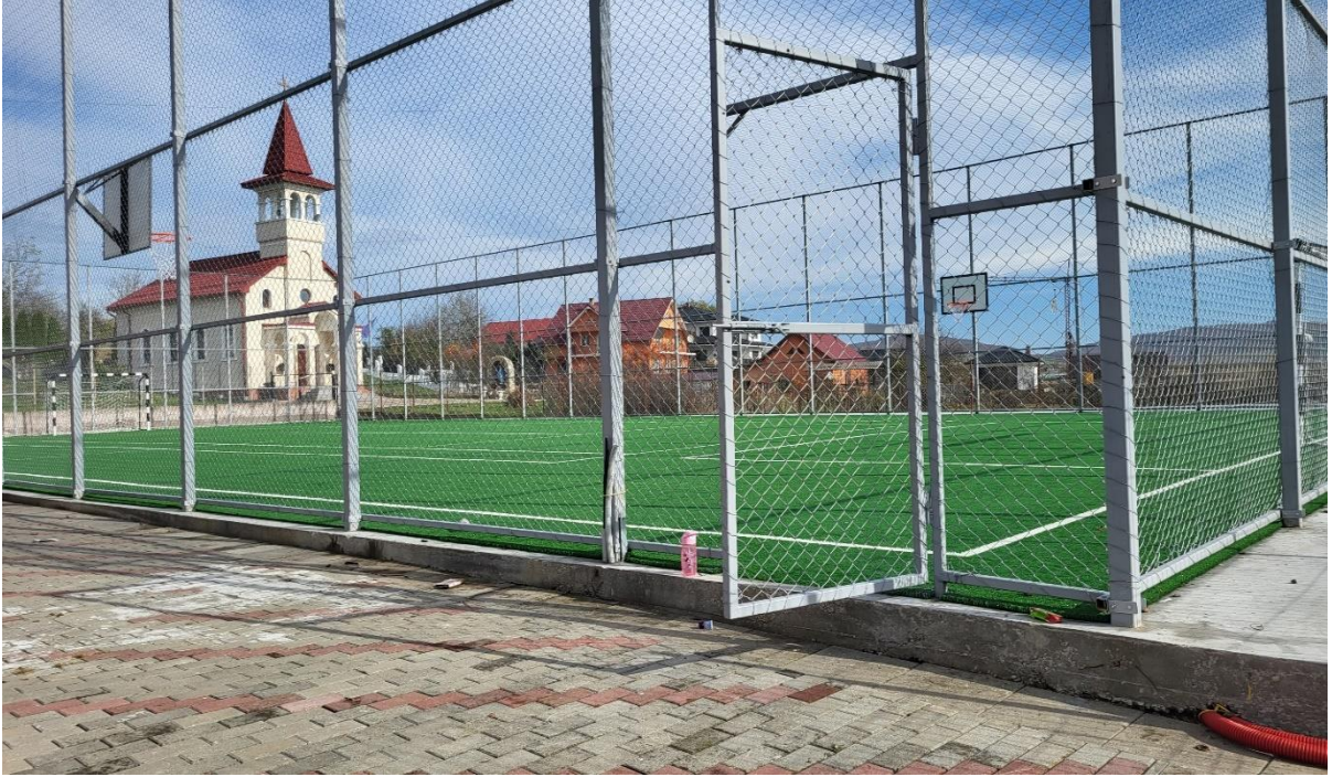
Terenul de sport nou în curtea școlii primare