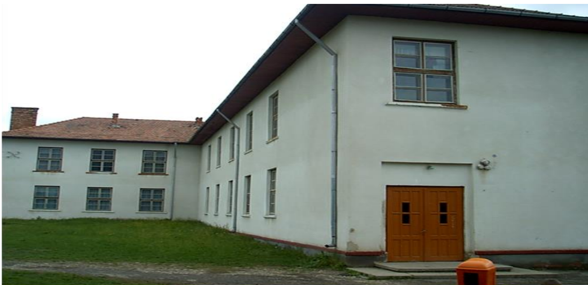
Clădirea Școlii Generale Uriu, înainte de reabilitare

În anul 2012, conform Legii nr. 1/2011, toate structurile școlare din comună trec în subordinea școlii din centrul de comună sub denumirea de Școala Gimnazială Uriu.