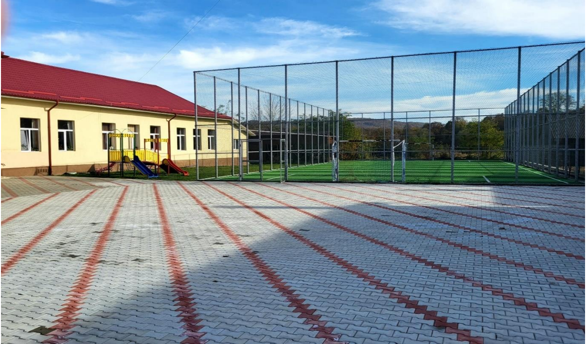
Școala Primară Ilișua, structură reabilitată, cu teren sintetic de sport