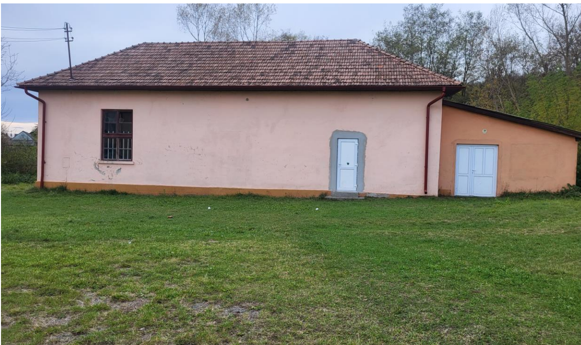
Atelierul vechi, transformat/adaptat ca sală de sport