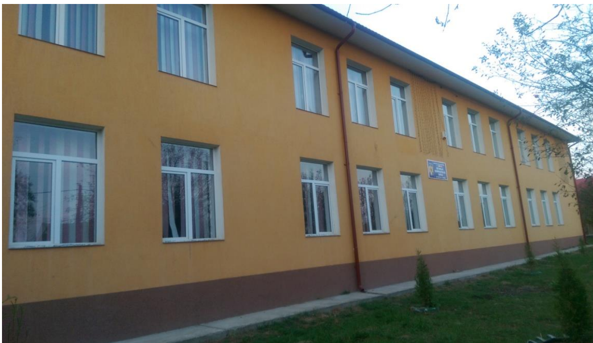
Clădirea Școlii Generale Uriu, după reabilitare